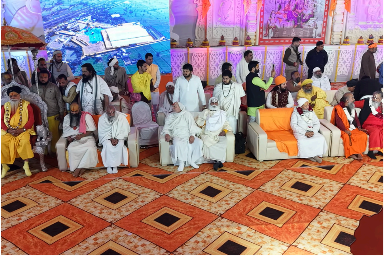
रामकथा के इस दिव्य आयोजन में विभिन्न उच्च कोटि के संतों का पावन संगम अद्भुत आध्यात्मिक ऊर्जा का संचार करता हुआ ।