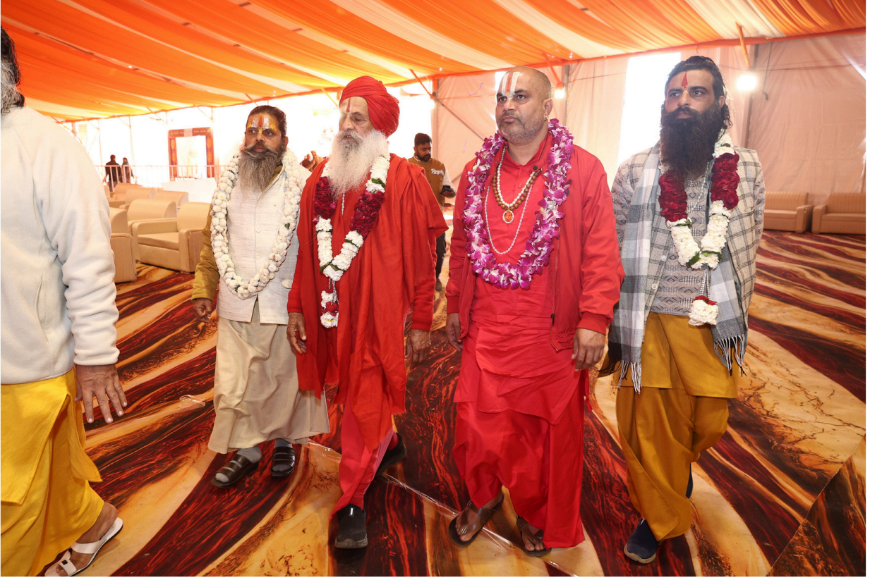
श्री रामकथा समारोह में पूज्य संतों का भव्य आगमन हुआ