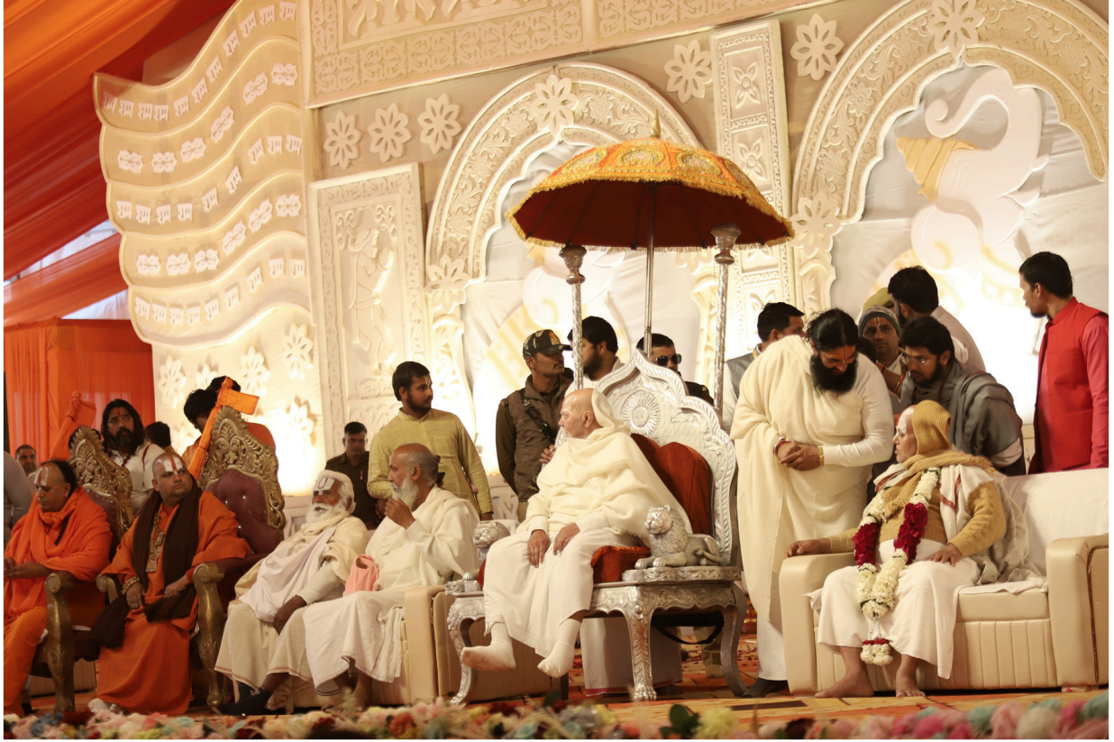
रामकथा के इस दिव्य आयोजन में विभिन्न उच्च कोटि के संतों का पावन संगम अद्भुत आध्यात्मिक ऊर्जा का संचार करता हुआ ।