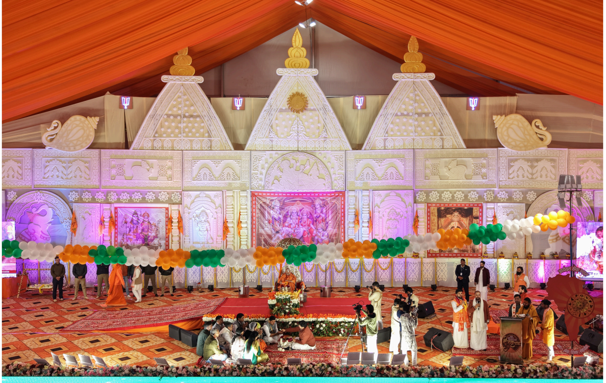
जगद्गुरु रामभद्राचार्य जी के आगमन हेतु सुसज्जित भव्य मंच — श्रद्धा, भक्ति और दिव्यता से आलोकित वातावरण