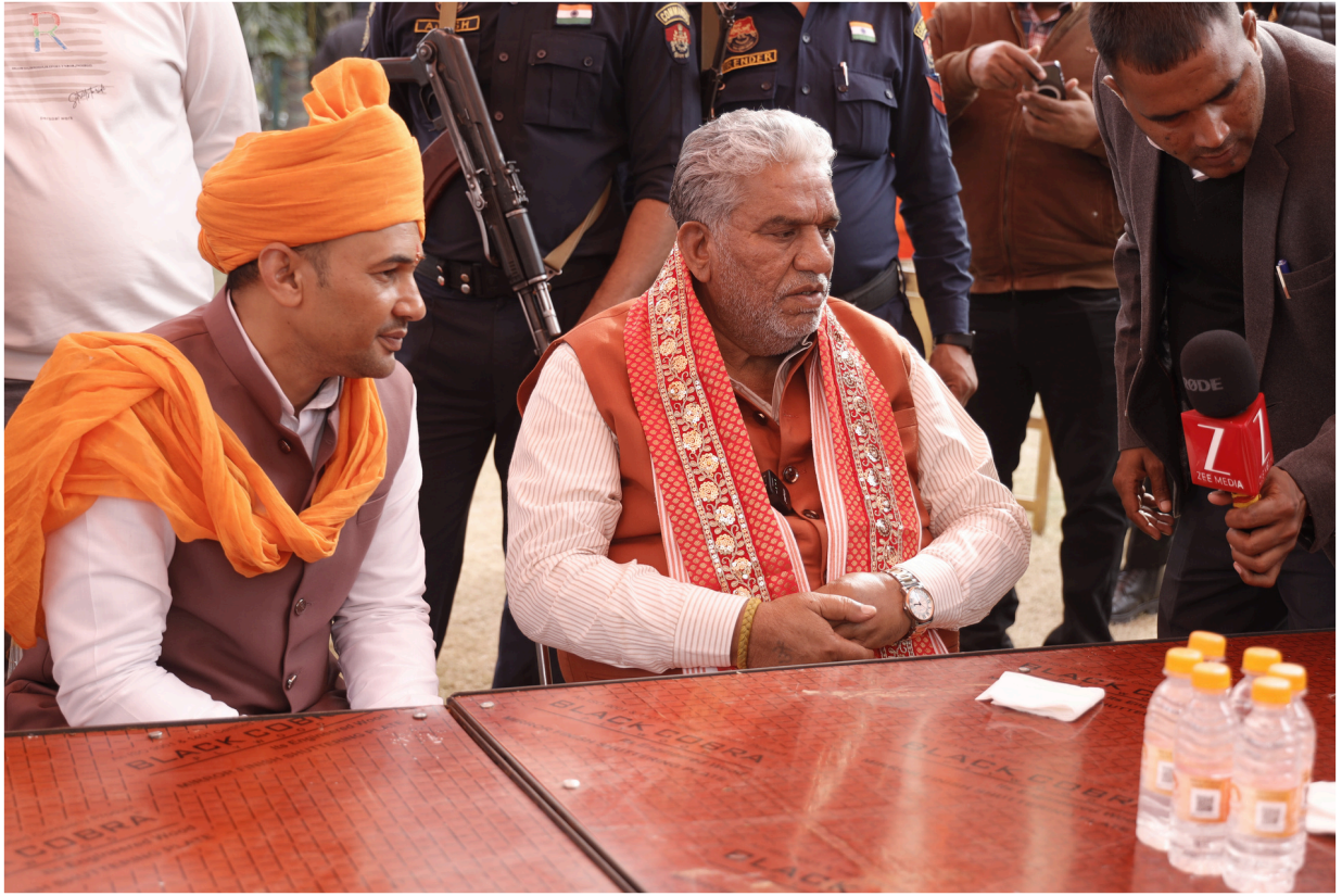
हरियाणा के माननीय कैबिनेट मंत्री श्री कृष्ण लाल पंवार का पावन रामकथा आयोजन में आगमन