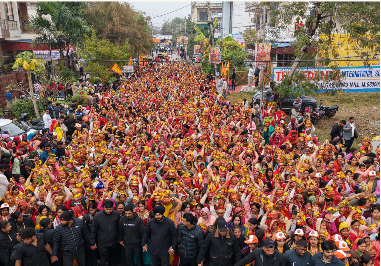
कलश यात्रा के दौरान उमड़ी श्रद्धालुओं की भव्य भीड़ ने पूरे वातावरण को भक्ति और उल्लास से सराबोर कर दिया।