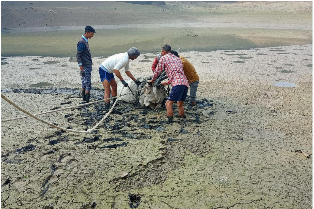
गौ रक्षा दल की पूरी टीम ने मिलकर एक गौ माता को सुरक्षित बचाया