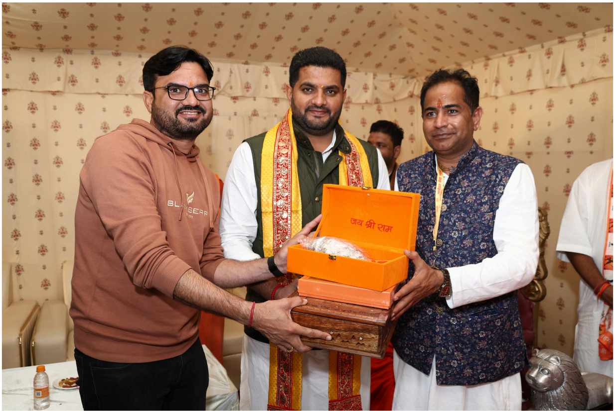
माननीय विधायक श्री जस्सी पेटवाड़ जी का रामकथा के इस दिव्य आयोजन में आगमन हम सभी के लिए हर्ष और सम्मान का विषय रहा ।