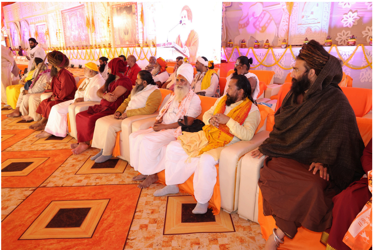
पूज्य संतगण श्री रामकथा का श्रवण करते हुए ।