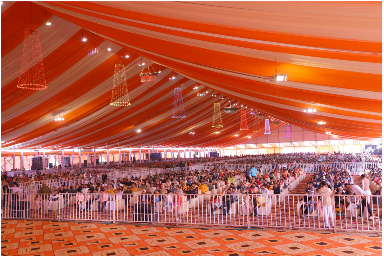
जगद्गुरु रामभद्राचार्य जी की पावन रामकथा में उमड़ी भक्तों की विशाल भीड़