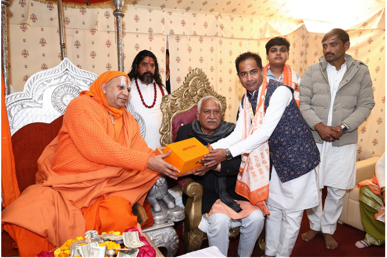
माननीय ओम प्रकाश यादव जी की गरिमामयी उपस्थिति ने रामकथा के इस पावन आयोजन को विशेष ऊर्जा और सम्मान प्रदान किया ।