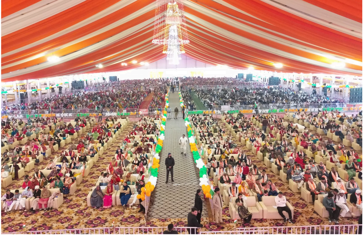
रामकथा के इस पावन आयोजन में उमड़ा श्रद्धालुओं का जनसागर भक्ति, आस्था और उत्साह का अद्भुत संगम प्रस्तुत कर रहा था।