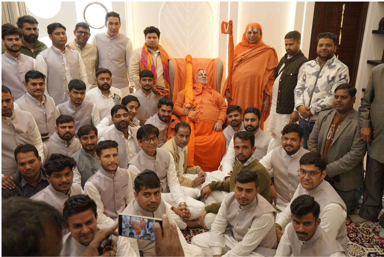
आर्यव्रत सेवा न्यास की समर्पित टीम के अथक प्रयासों और सेवा भाव से रामकथा का यह भव्य आयोजन सफलतापूर्वक संपन्न हुआ।