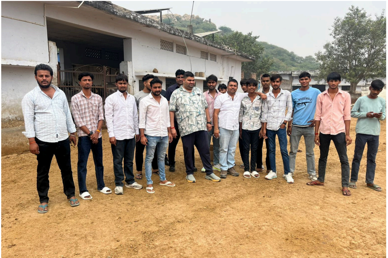
आर्यव्रत सेवा न्यास के गौ रक्षा प्रकोष्ठ की समर्पित टीम गौमाता की रक्षा के इस पावन संकल्प में उनका योगदान समाज के लिए एक आदर्श उदाहरण है ।